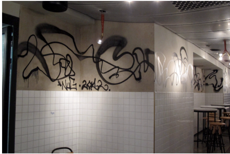
Green Spag (Grön), Spag , 2012